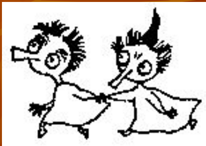
Тофсла и Вифсла