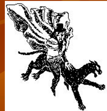
Волшебник и его Пантера