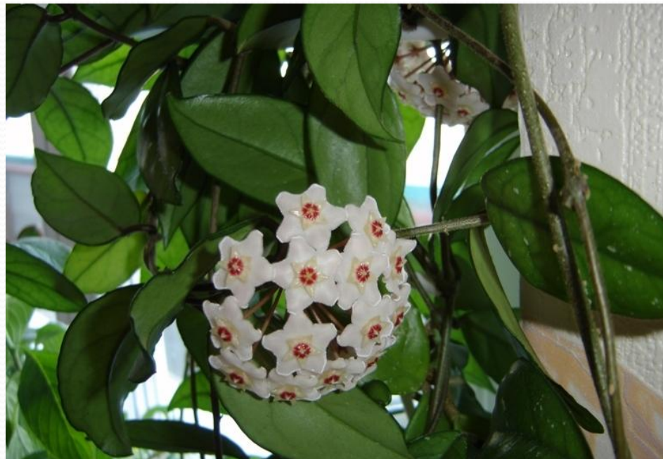
Хойя мясистая (восковой плющ)