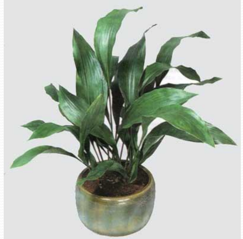
Аспидистра ( дружная семейка)