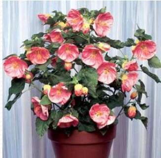
Абутилон (Комнатный клён)