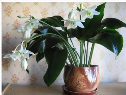
Эухарис (Амазонская лилия)