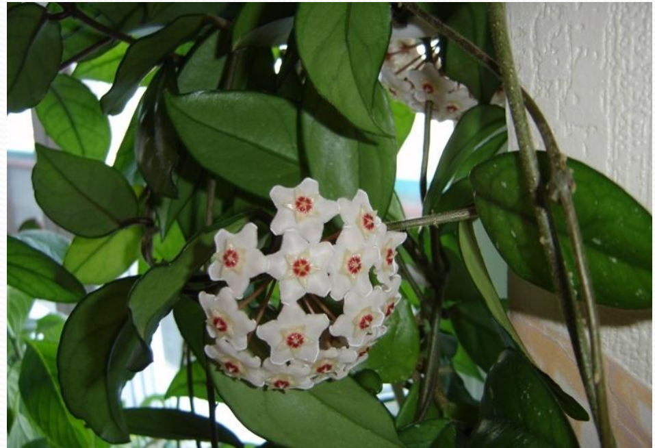
Хойя мясистая (восковой плющ)