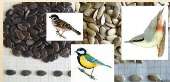
семечки арбуза и дыни