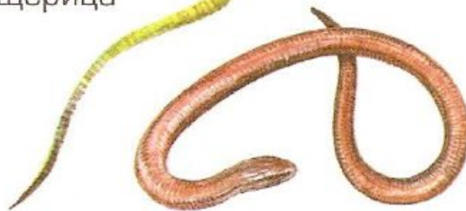
безногая ящерица веретеница