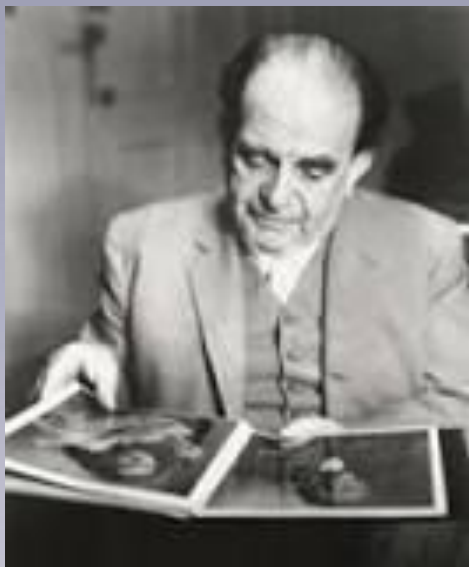
Карл Кёниг – австрийский медик, лечебный педагог

Велика роль музыки на ребенка с ограниченными возможностями здоровья: