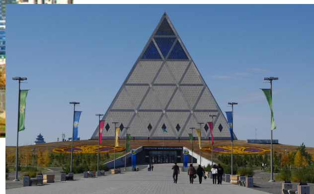
Дворец Мира и Согласия