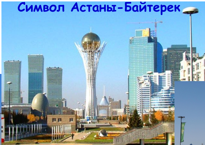
Символ Астаны - Байтерек