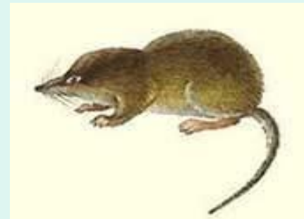
толща земли (кроты, землеройки)