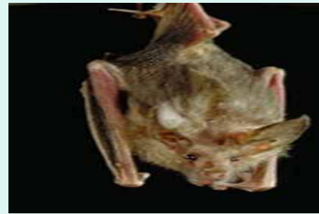
воздушная (летучие мыши)