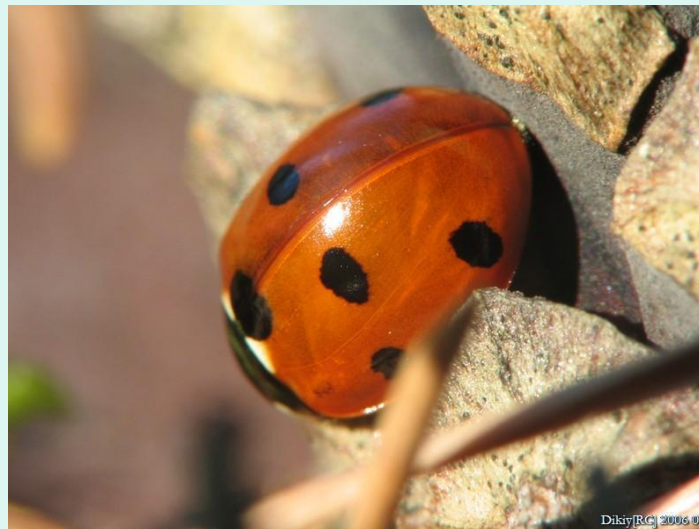
Божья коровка. Насекомые