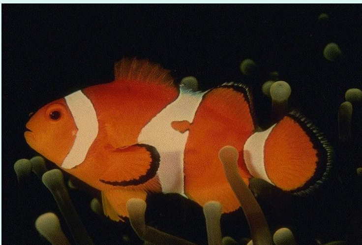
Рыба клоун. Рыбы