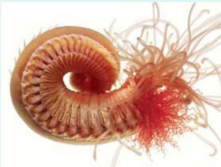
Морской червь. Черви