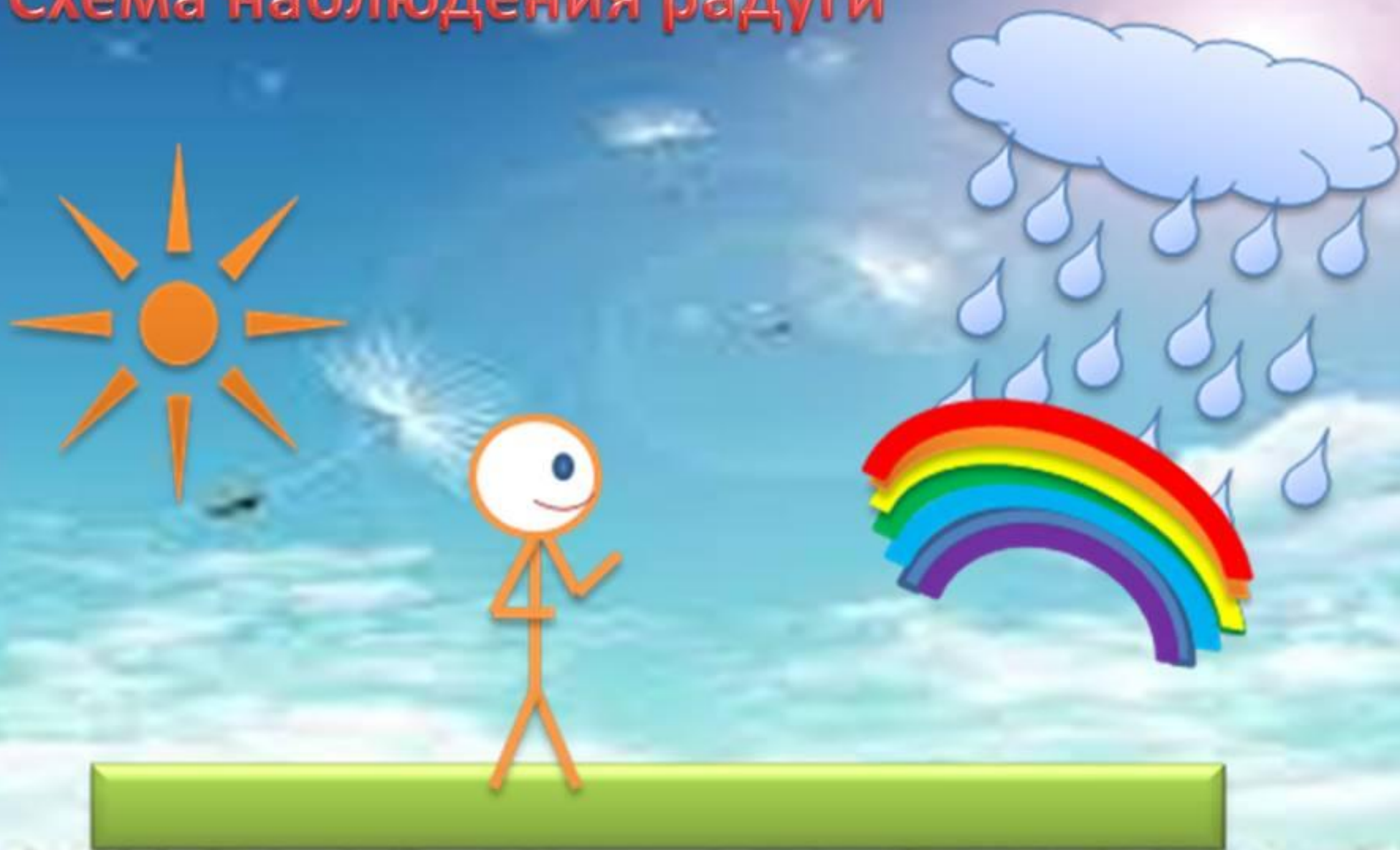
Схема наблюдения радуги

Радуга появляется когда идет дождь и одновременно светит солнце. Необходимо быть строго между солнцем и дождем.