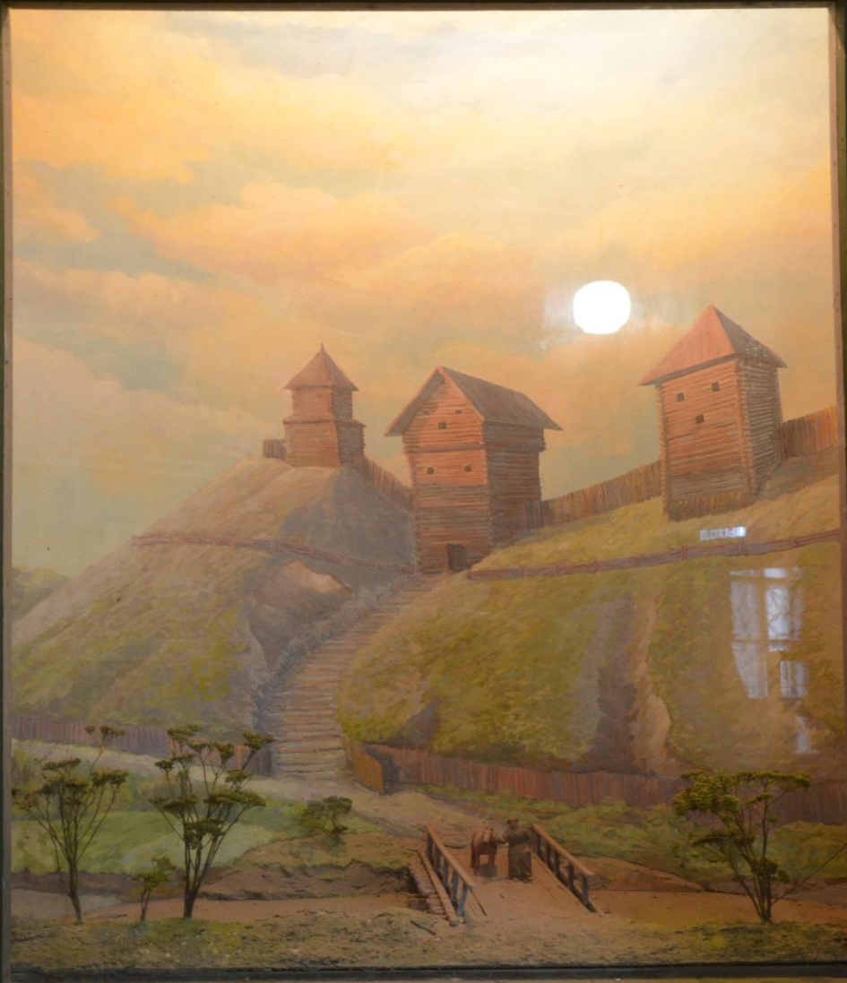
РУССКОЕ ГОРОДИЩЕ, XII ВЕК