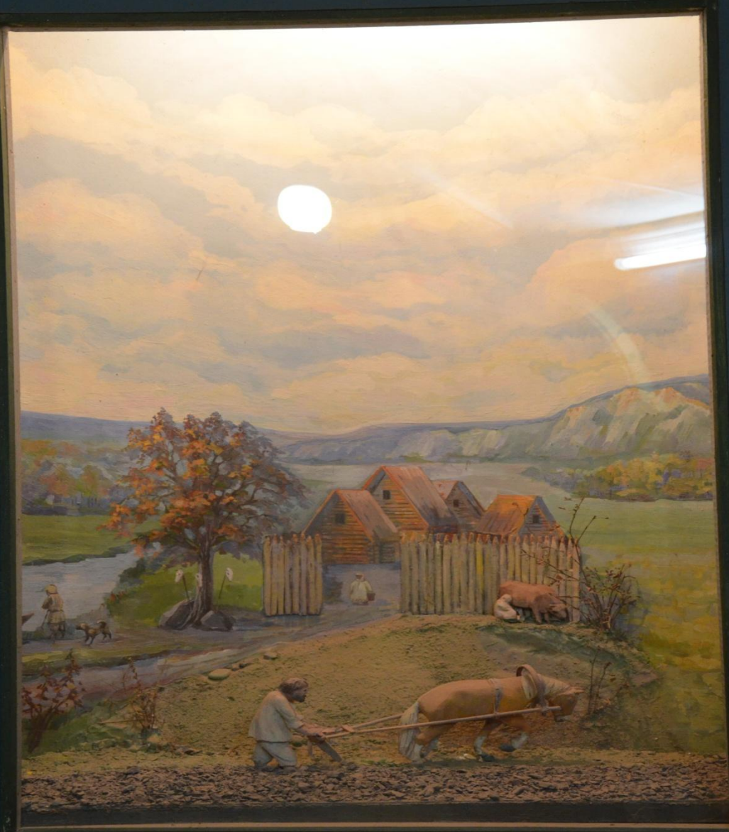
ПРАСЛАВЯНЕ В НАШЕМ КРАЕ, IV ВЕК Н. Э.