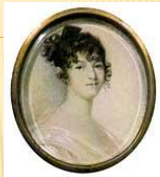
Мать, Надежда Осиповна Пушкина