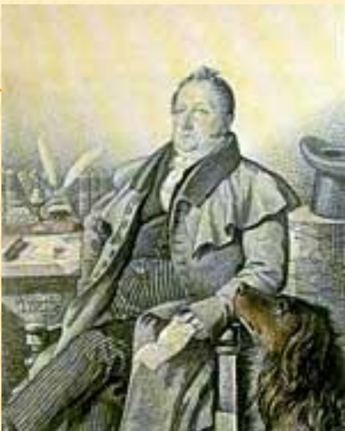
Отец, Сергей Львович Пушкин