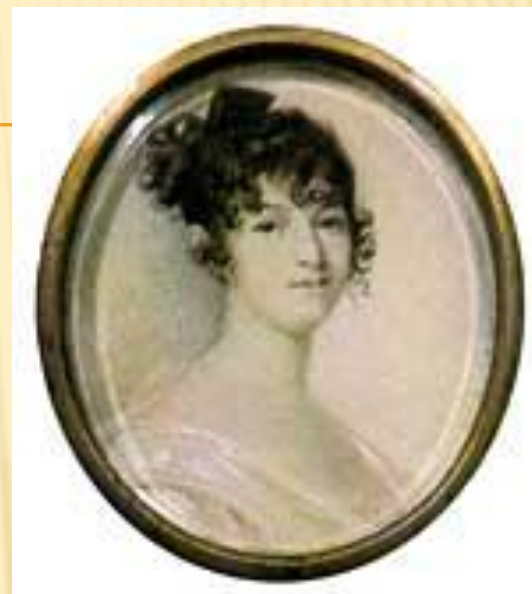
Мать, Надежда Осиповна Пушкина