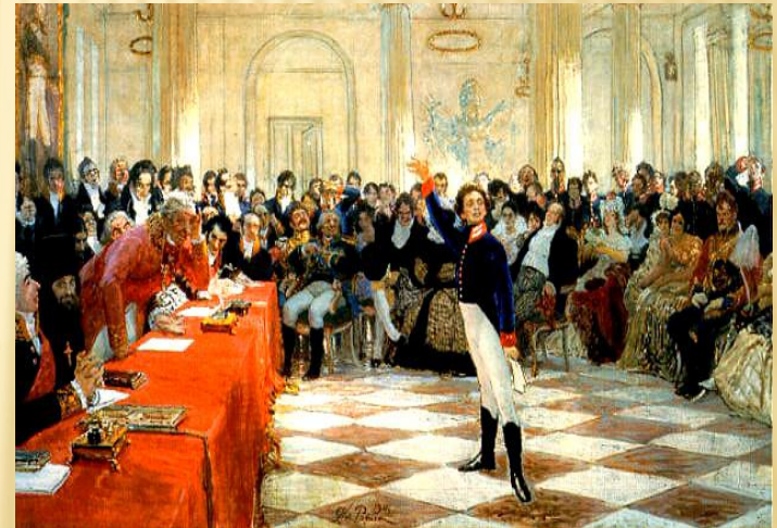
Пушкин на лицейском экзамене читает свои стихи «Воспоминания в Царском Селе»