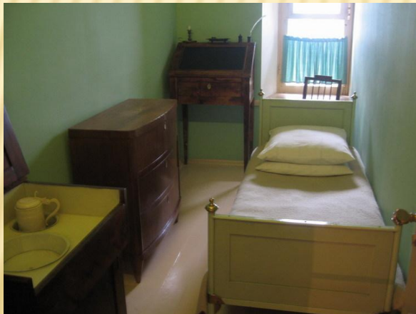
Комната А.С. Пушкина в лицее