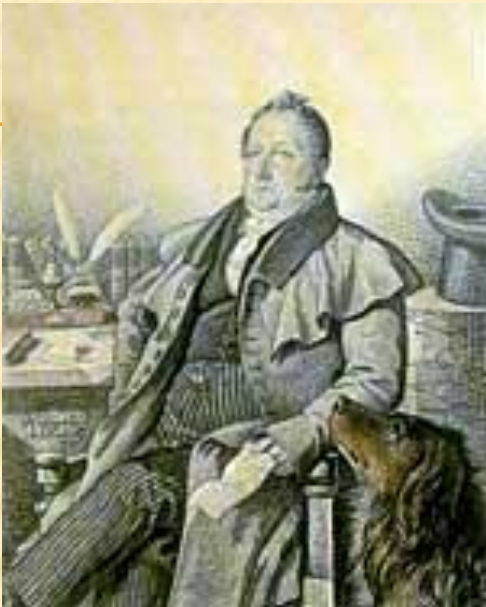
Отец, Сергей Львович Пушкин