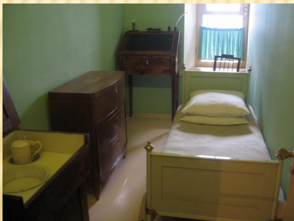
Комната А.С. Пушкина в лицее