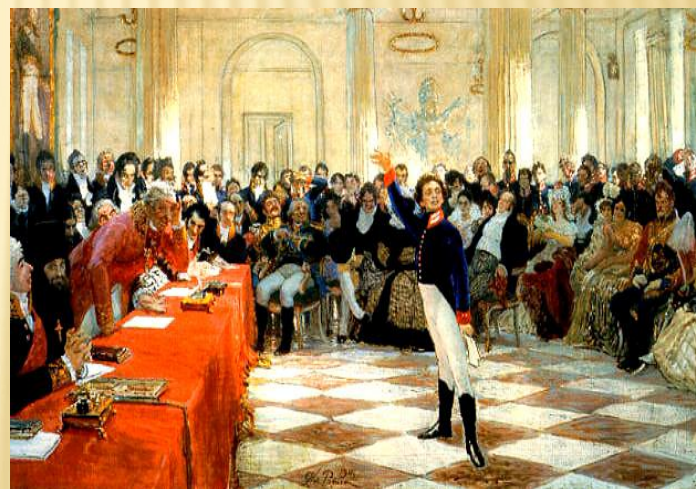
Пушкин на лицейском экзамене читает свои стихи «Воспоминания в Царском Селе»