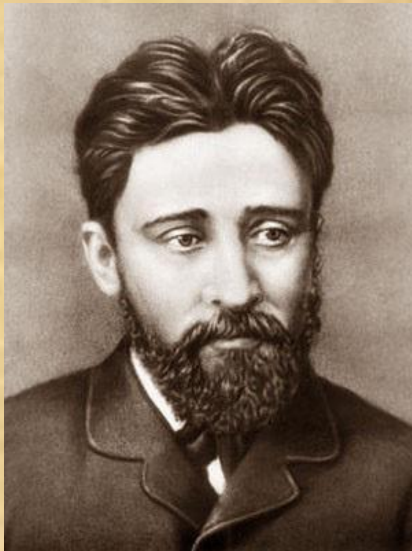
В.М. Гаршин (1855-1888)