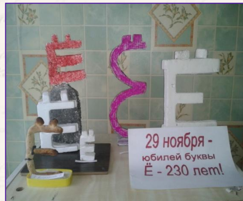
«Памятник букве Ё»