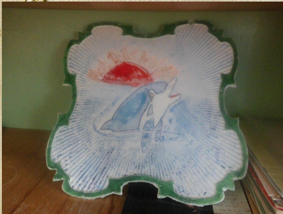
← «Герб моей семьи»