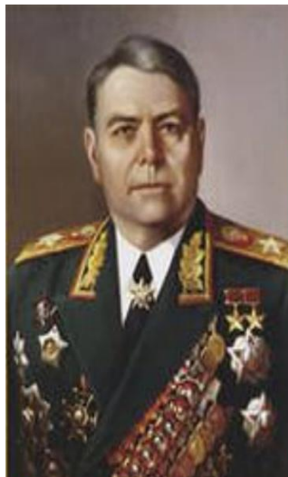
Александр Михайлович Василевский (1895 – 1977) Маршал Советского союза, дважды герой. Награжден двумя орденами победы

Маршал Советского Союза Конев Иван Степанович