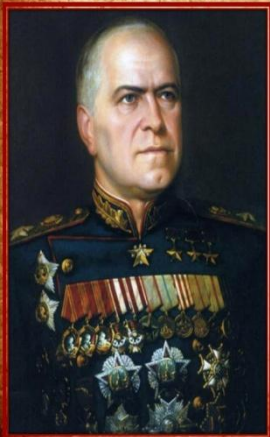
Жуков Георгий Константинович