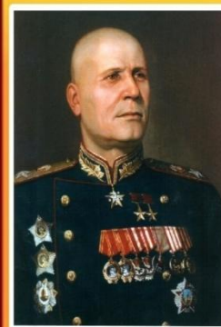
Командующий 1-м Украинским фронтом Конев И.С. (30 марта 1945 года) - за освобождение Польши и форсирование Одера

Маршал Советского Союза Конев Иван Степанович