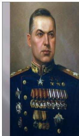
Маршал Советского Союза Константин Константинович Рокоссовский.

Семен Константинович Тимошенко (1895-1970 гг.)