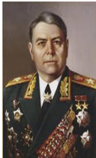
Александр Михайлович Василевский (1895 – 1977) Маршал Советского союза, дважды герой. Награжден двумя орденами победы

Маршал Советского Союза Конев Иван Степанович