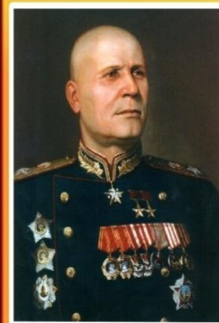
Командующий 1-м Украинским фронтом Конев И.С. (30 марта 1945 года) - за освобождение Польши и форсирование Одера

Маршал Советского Союза Конев Иван Степанович