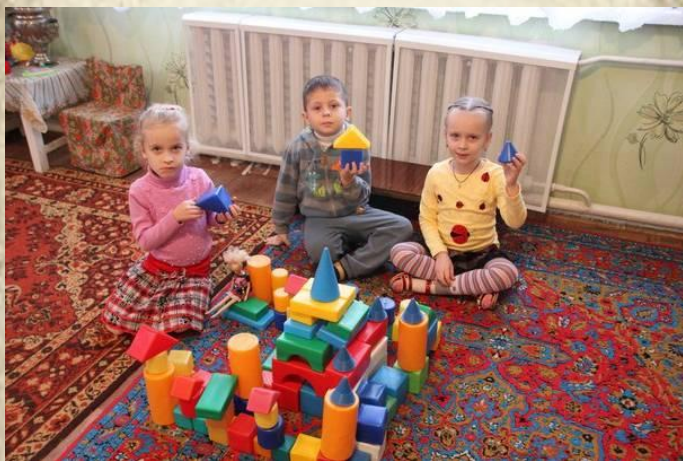
Игра «Мы строители»