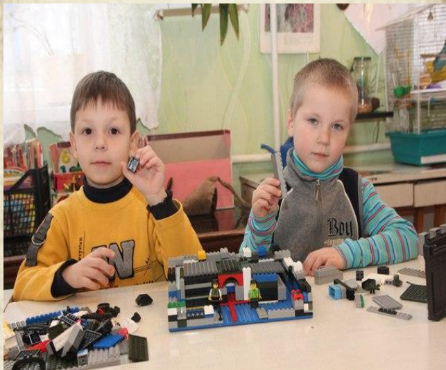
Улицы нашего города