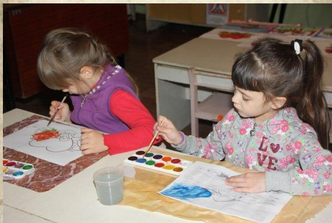
Рисование «Мой город»