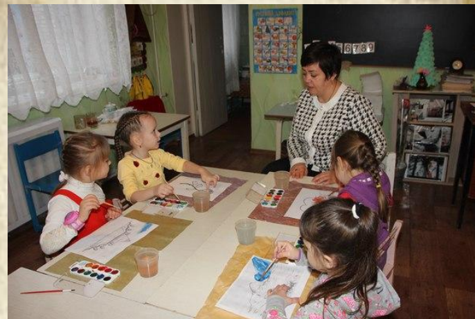
Рисование «Символика Донецка»