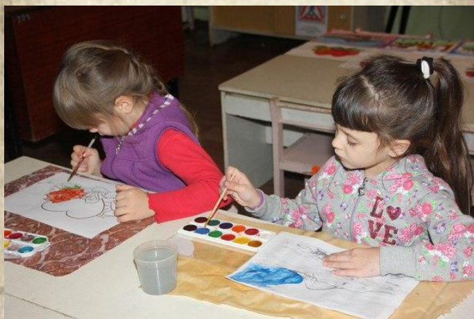
Рисование «Мой город»