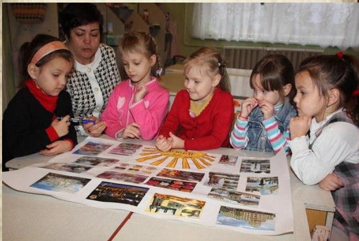
Составление и выпуск газеты: «Мой город».