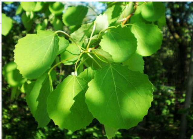
Лист осины дрожит