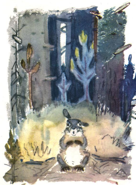
Дрожит от страха