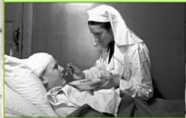
Великая княгиня Елизавета Федоровна