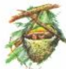
Гнездо из мха, шерсти, перьев