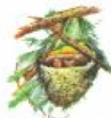
Гнездо из мха, шерсти, перьев