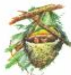
Гнездо из мха, шерсти, перьев