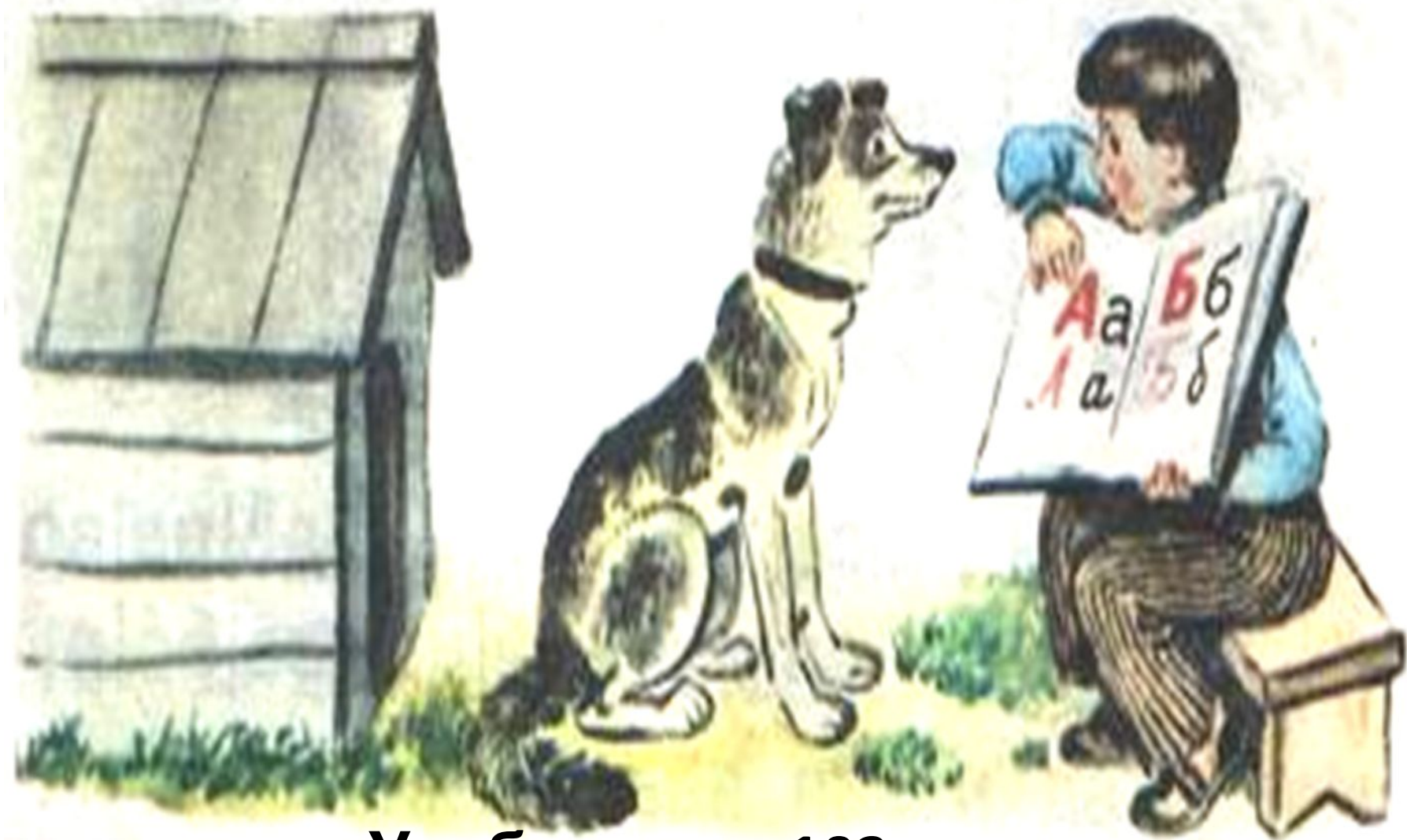
Учебник стр.103. Виталик и Бобик.