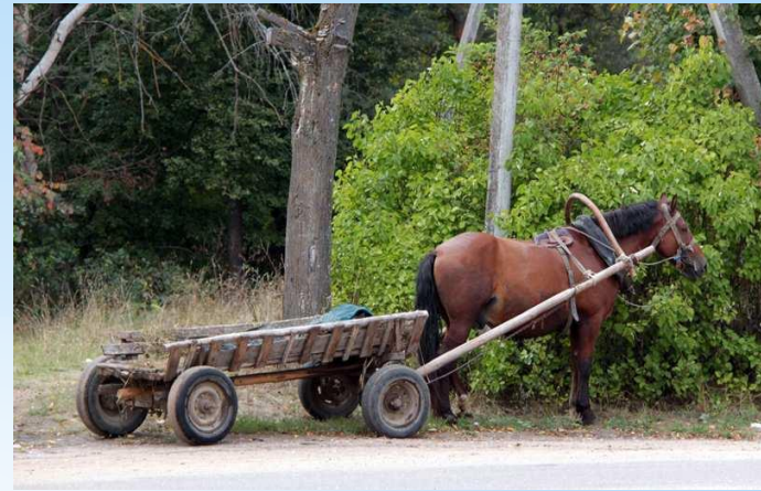
Подвода - телега, запряженная лошадью.