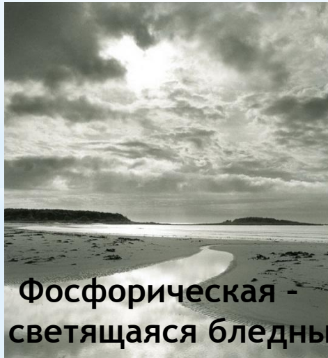
Фосфорическая - светящаяся бледным светом.