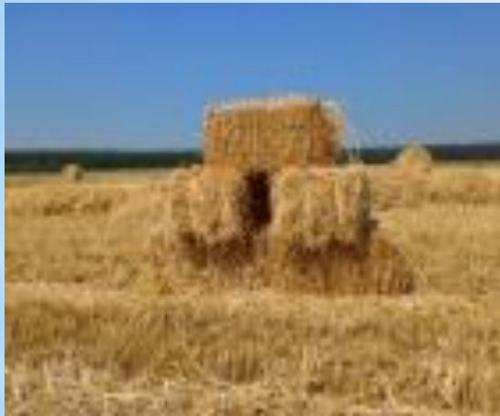
Тюк - большая связка сена (соломы).