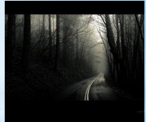
Потёмки - отсутствие света, темнота.