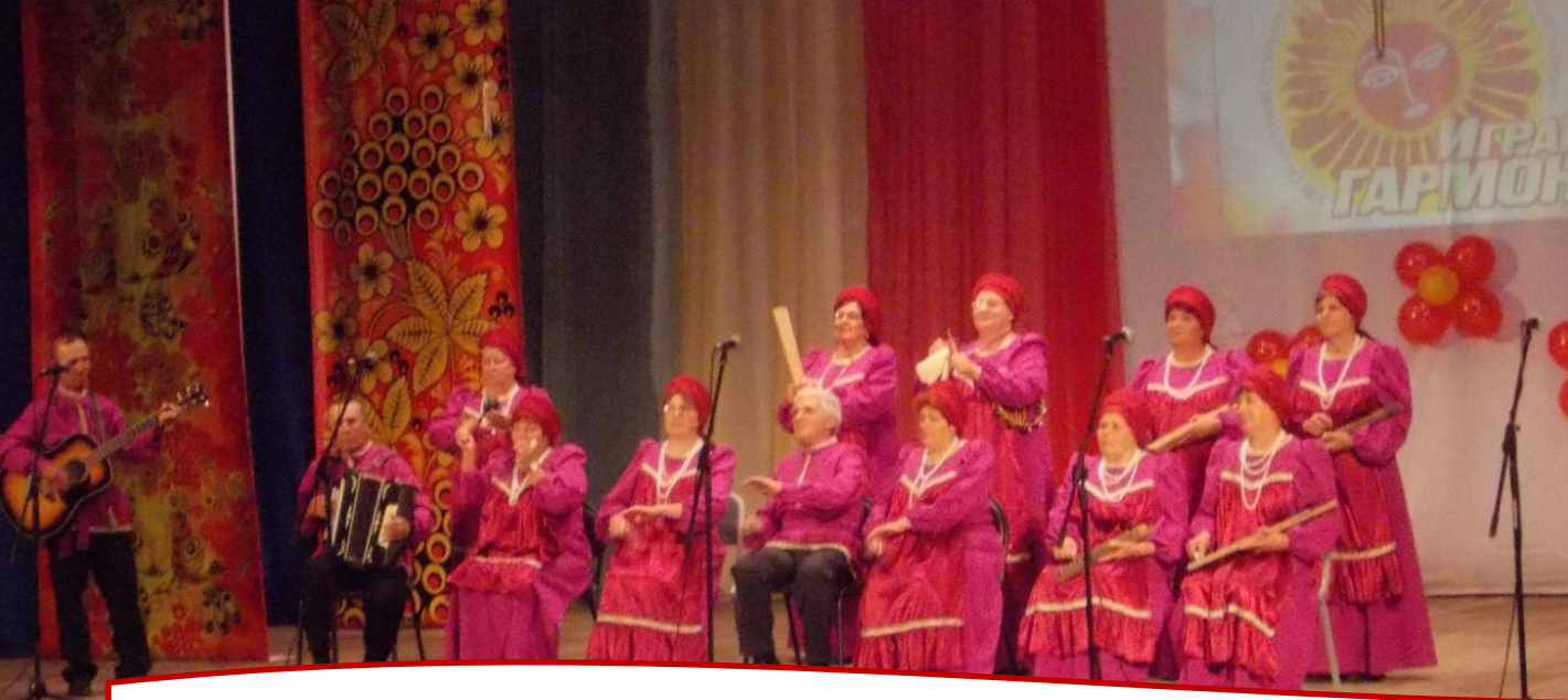
Выступления на конкурсах и в концертных программах.