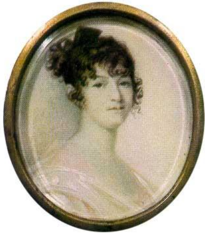
Н.О. Пушкина. 1800-е гг.

Мать, Надежда Осиповна , приходилась внучкой арапу Петра I, впоследствии русскому генералу Ганнибалу.