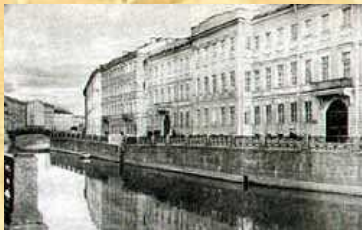
Квартира Пушкина в Петербурге на Набережной Мойки

С середины октября 1831 г. и уже до конца жизни Пушкин с семьей живет в Петербурге.