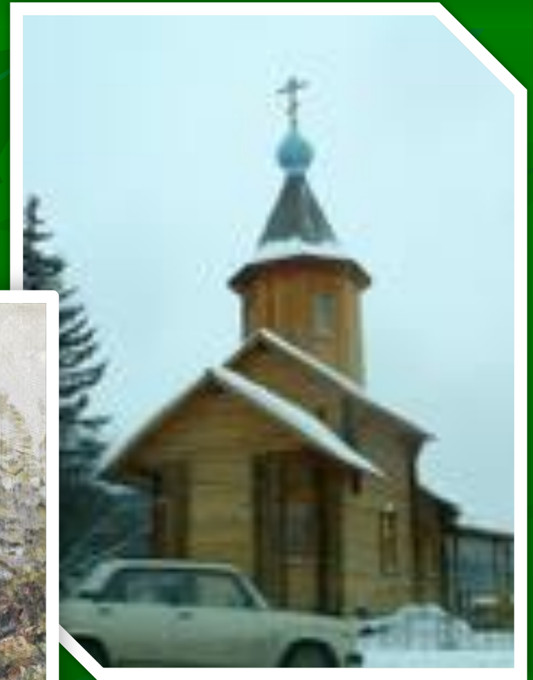
Церковь Иннокентия епископа Иркутского