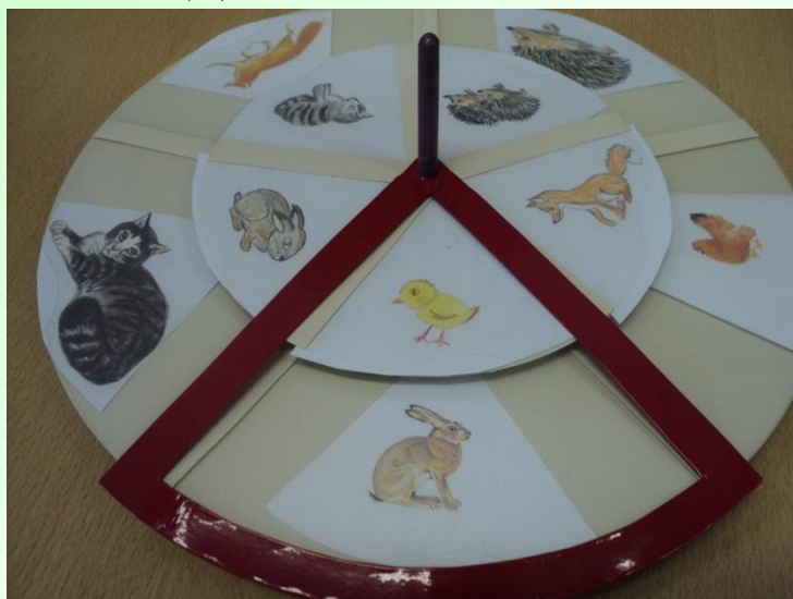
Д/И «Чей детеныш?»