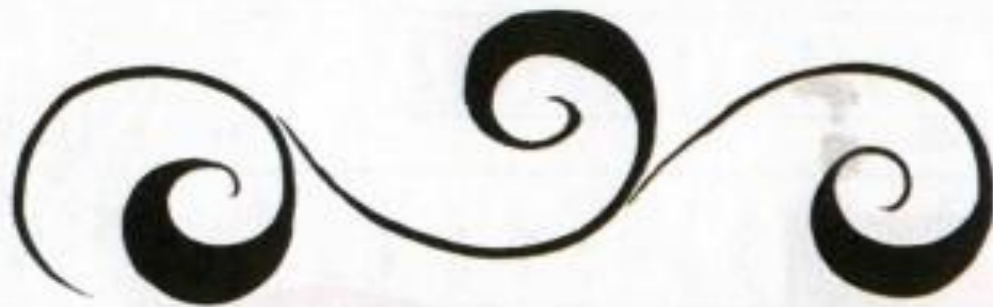
ВЕДУЩИЙ СТЕБЕЛЬ – «КРИУЛЬ»