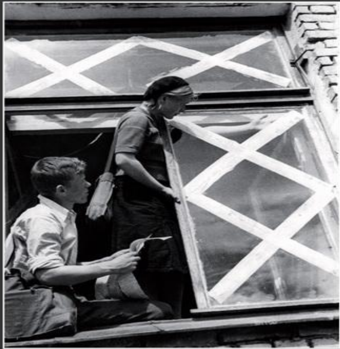
Девушка и юноша, оклеивающие бумажными полосами окно. 1941 г.