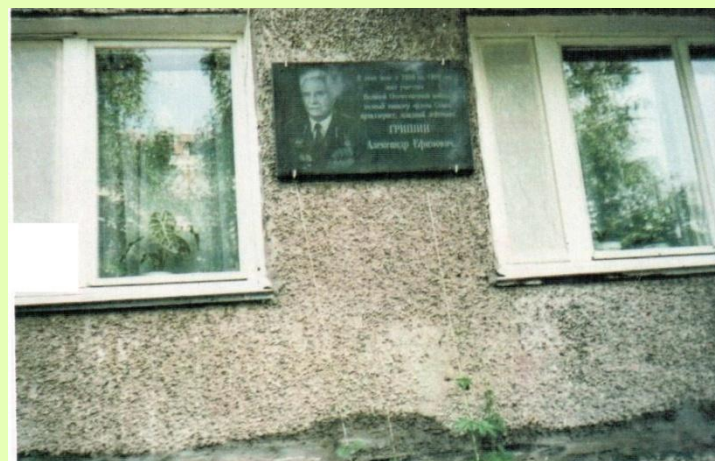
Мемориальная доска на доме, в котором жил А.Е.Гришин в последние годы. Нижний Новгород