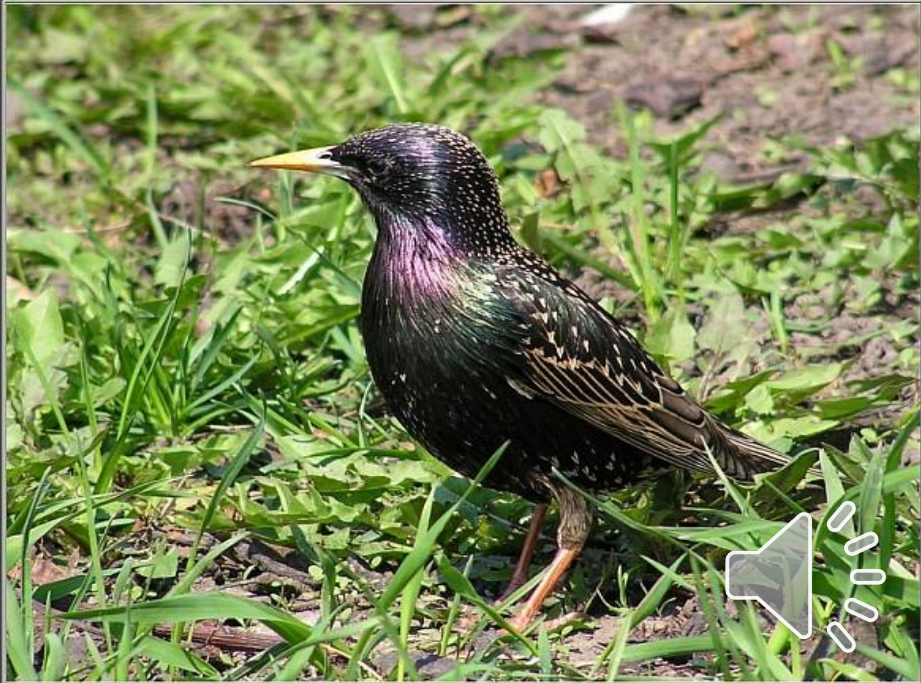
Скворец обыкновенный ( Sturnus vulgaris )