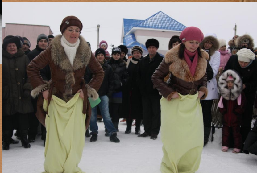
Прыжки в мешках