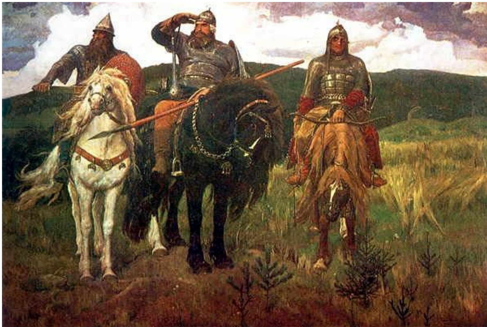
Виктор Михайлович Васнецов «Три богатыря»