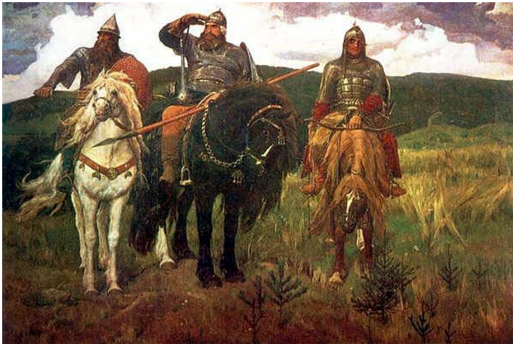
Виктор Михайлович Васнецов «Три богатыря»