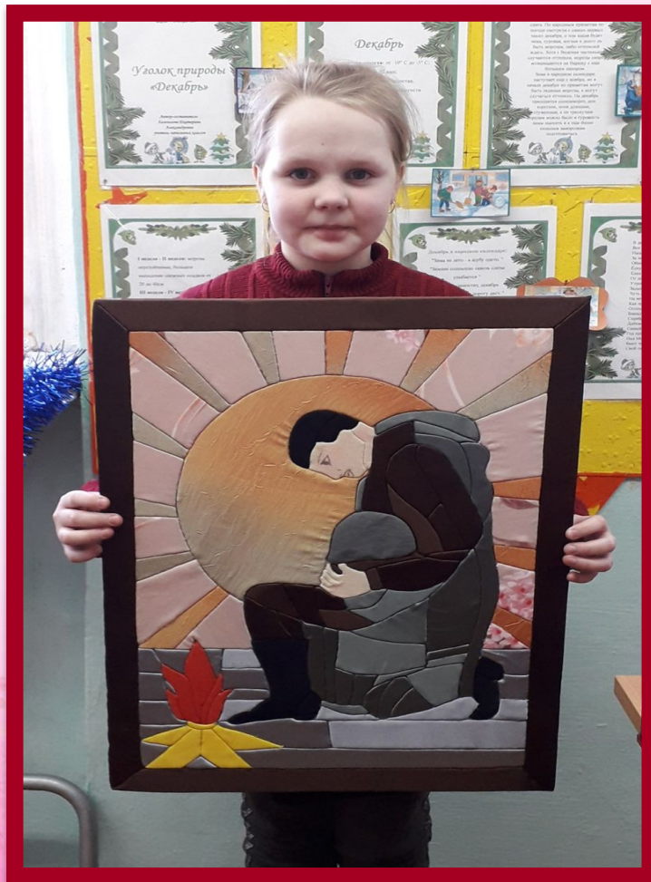
«Солдат у вечного огня»

Вечная память героям! ПОМНИМ, ЧТИМ, ГОРДИМСЯ!