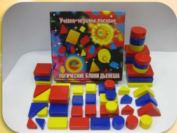
❖ Блоки Дьенеша