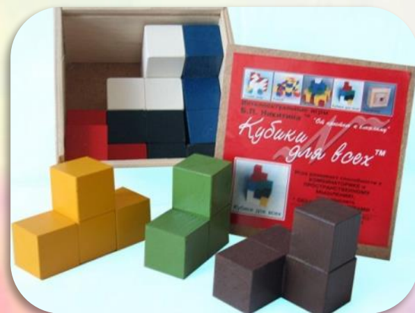
❖ Кубики Никитина