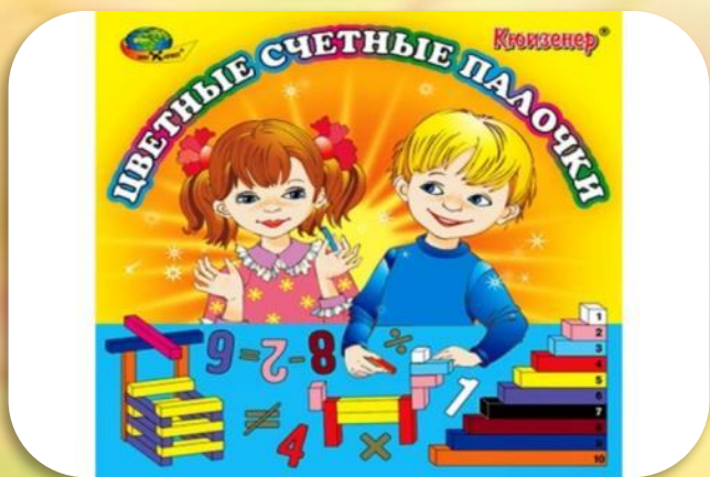
❖ Палочки Кюизинера