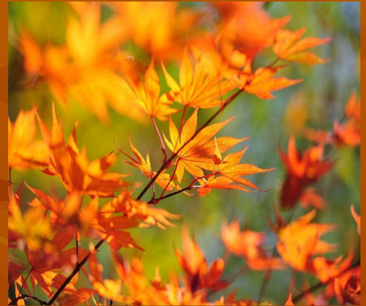
золотой- желтый цвет