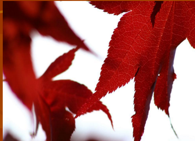
багряный- насыщенный красный цвет