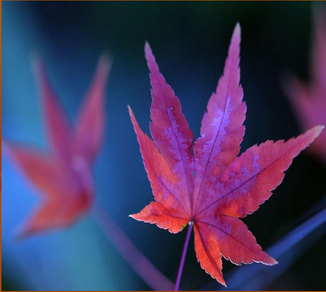
Лиловый- фиолетовый цвет с розовым оттенком