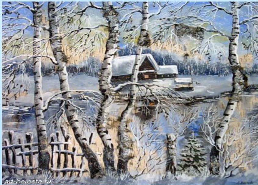
Берёзы у ручья. С.Ю. Карпова