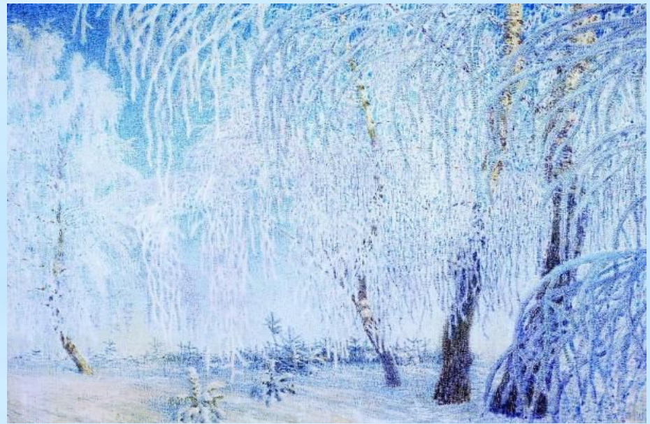
Снег. Берёзы. И.Э.