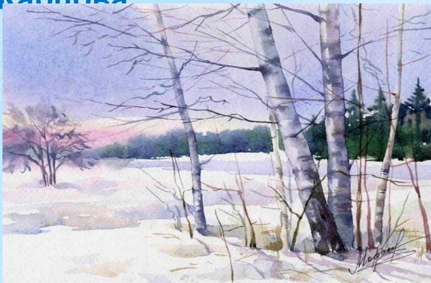
Русские берёзы. М.