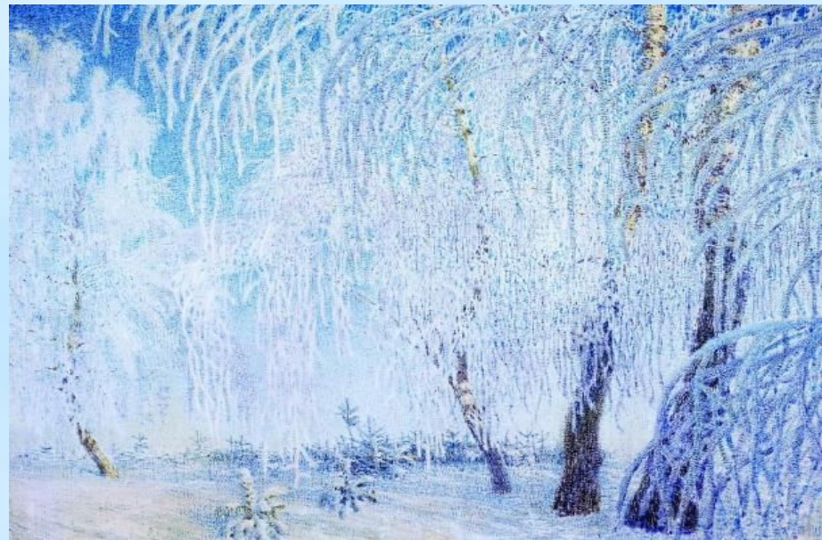
Снег. Берёзы. И.Э.