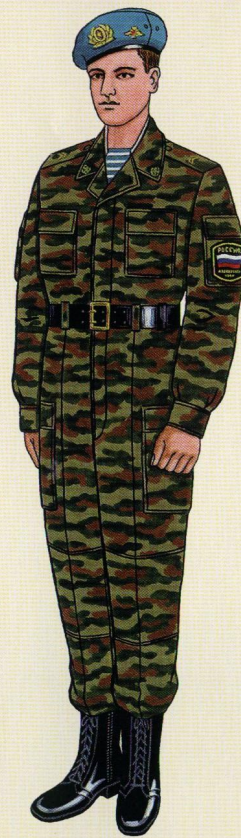
Парадная для строя и вне строя в ВДВ