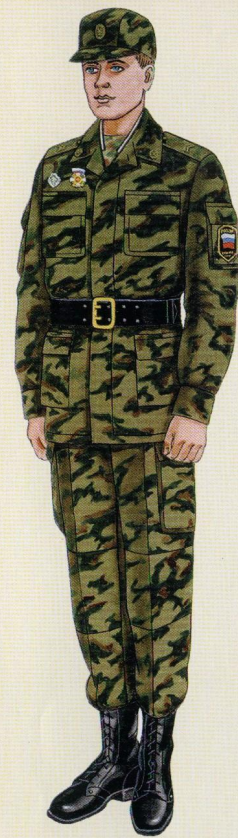
Повседневная для строя и вне строя