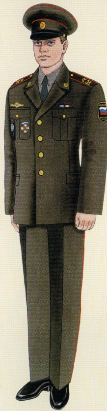
Парадная вне строя