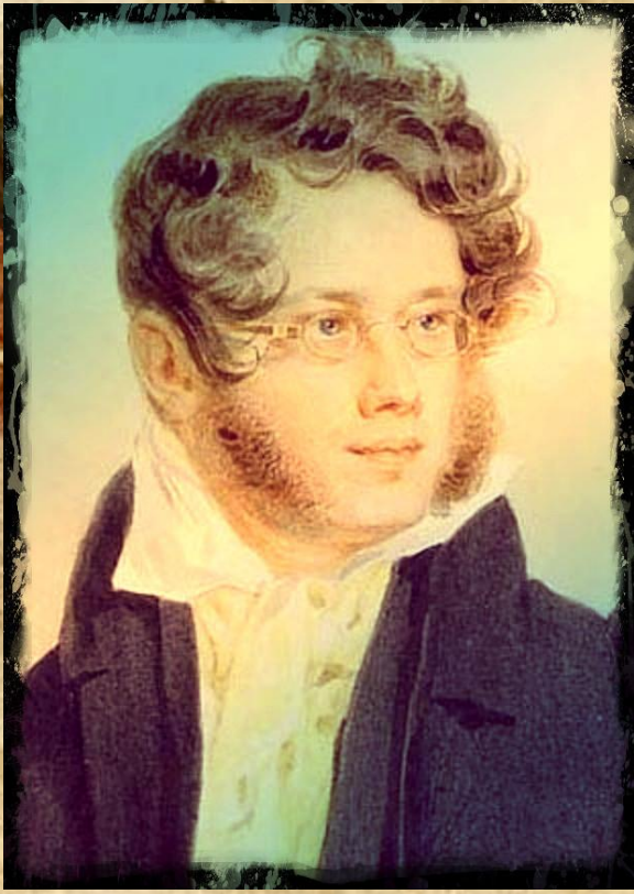
Вяземский Пётр Андреевич (1792-1878)

Не в славу, не в почет народные скрижали Родную нашу Русь Святой именовали, Но, в назиданье нам, в ответственность, в завет; Чтоб сберегали мы первоначальных лет Страх Божий, и любовь, и чистый пламень веры, Чтобы добрые дела и добрые примеры, В их древней простоте, завещанные нам, Мы цельно передать могли своим сынам.