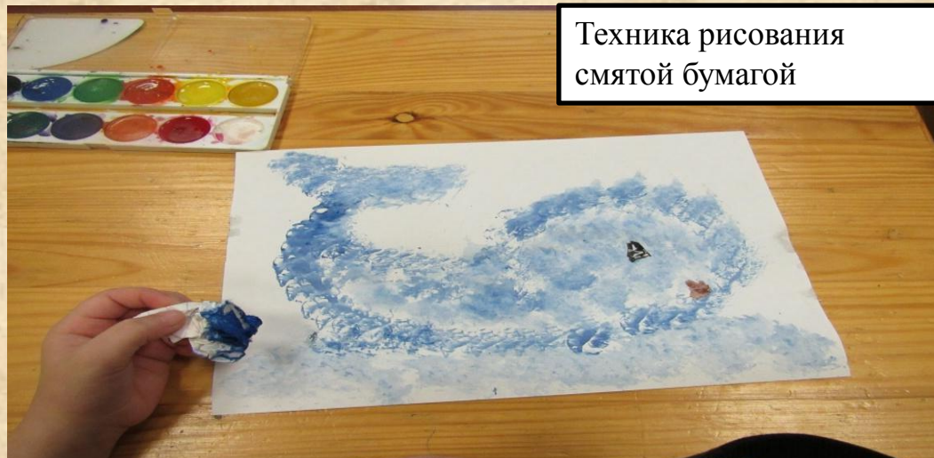
Техника рисования смятой бумагой

Наш опыт представляет систему работы, направленную на формирование творческих способностей детей дошкольного возраста на основе изучения и освоения различных техник рисования, которая включает в себя комплексные занятия, развивающие игры и упражнения, консультации для родителей, практические приёмы работы с различными материалами.