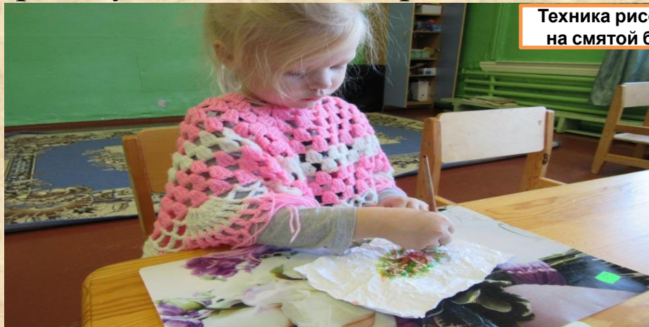
Техника рисования на смятой бумаге

Таким образом, занятия занимательного характера являются решающим фактором художественного развития дошкольника.