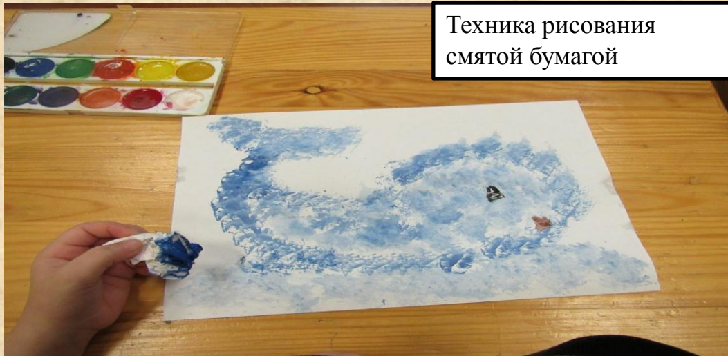
Техника рисования смятой бумагой

Наш опыт представляет систему работы, направленную на формирование творческих способностей детей дошкольного возраста на основе изучения и освоения различных техник рисования, которая включает в себя комплексные занятия, развивающие игры и упражнения, консультации для родителей, практические приёмы работы с различными материалами.