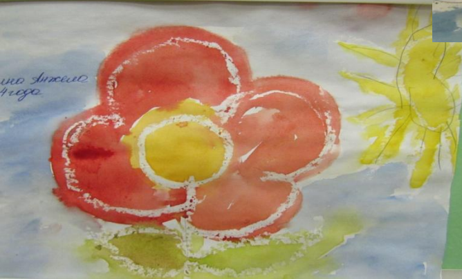
Рисование свечой + акварель