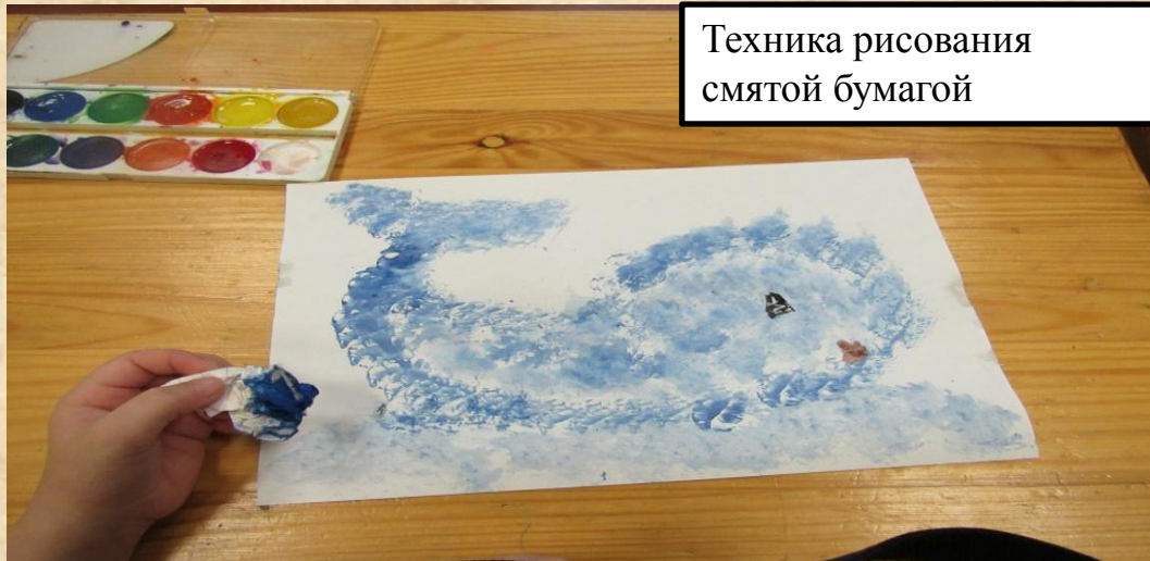
Техника рисования смятой бумагой

Наш опыт представляет систему работы, направленную на формирование творческих способностей детей дошкольного возраста на основе изучения и освоения различных техник рисования, которая включает в себя комплексные занятия, развивающие игры и упражнения, консультации для родителей, практические приёмы работы с различными материалами.