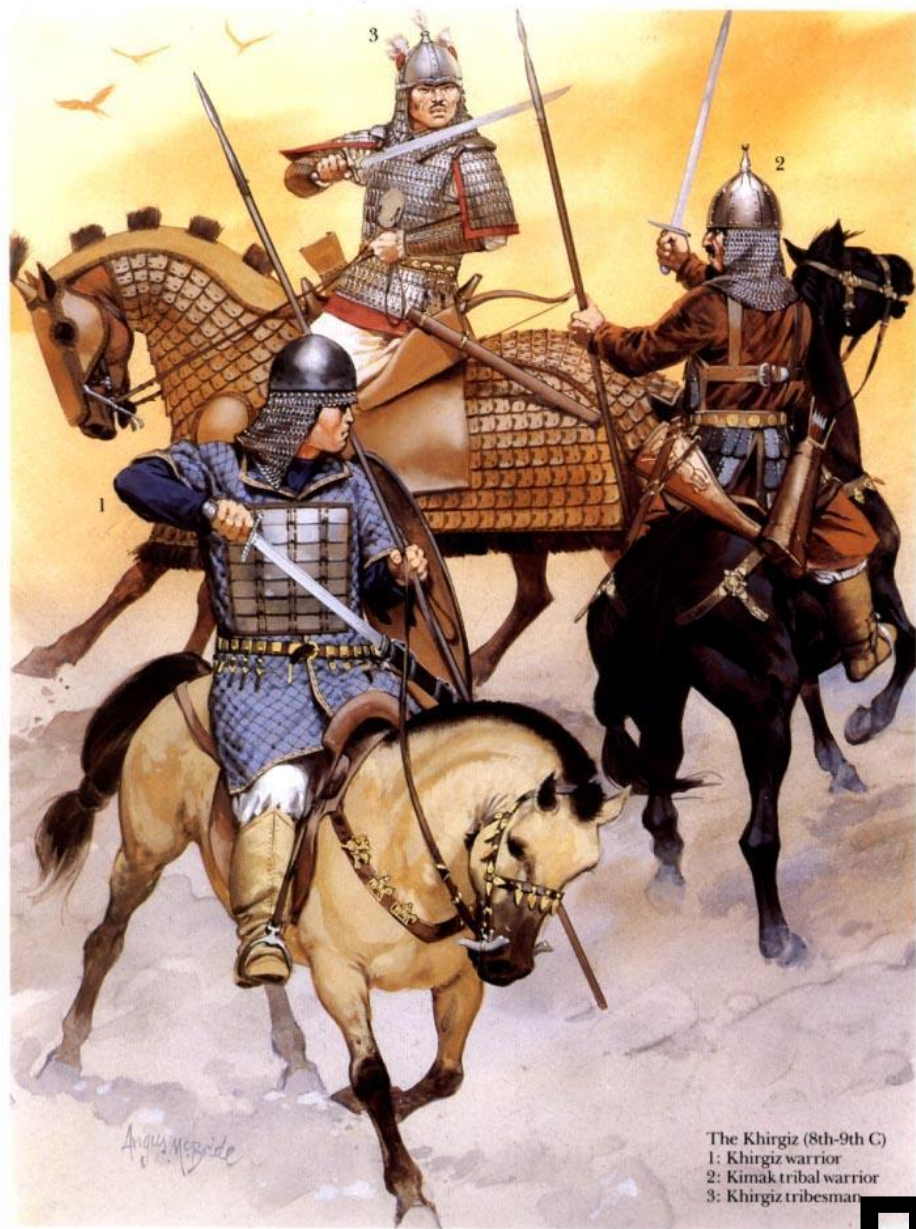
The Khirgiz (8th-9th C) 1: Khirgiz warrior 2: Kimak tribal warrior 3: Khirgiz tribesman