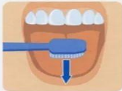
6. Чистка языка