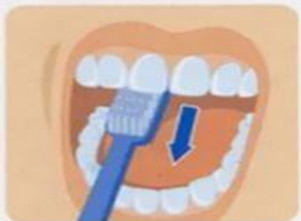
3. Внутренние поверхности передних зубов