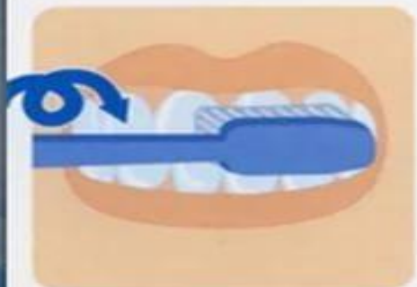
5. Массаж десен