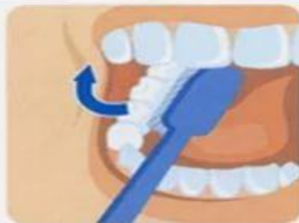
2. Внутренние поверхности зубов