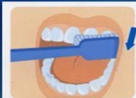
1. Наружные поверхности зубов