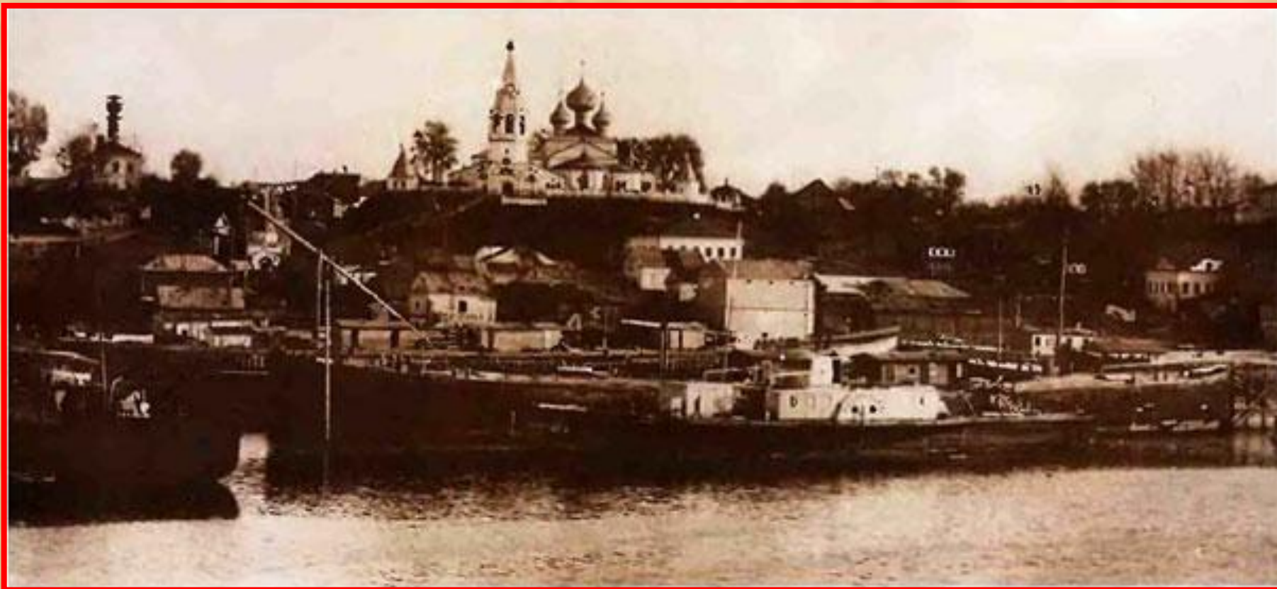
Вид Городца с Волги. Середина XIX в.