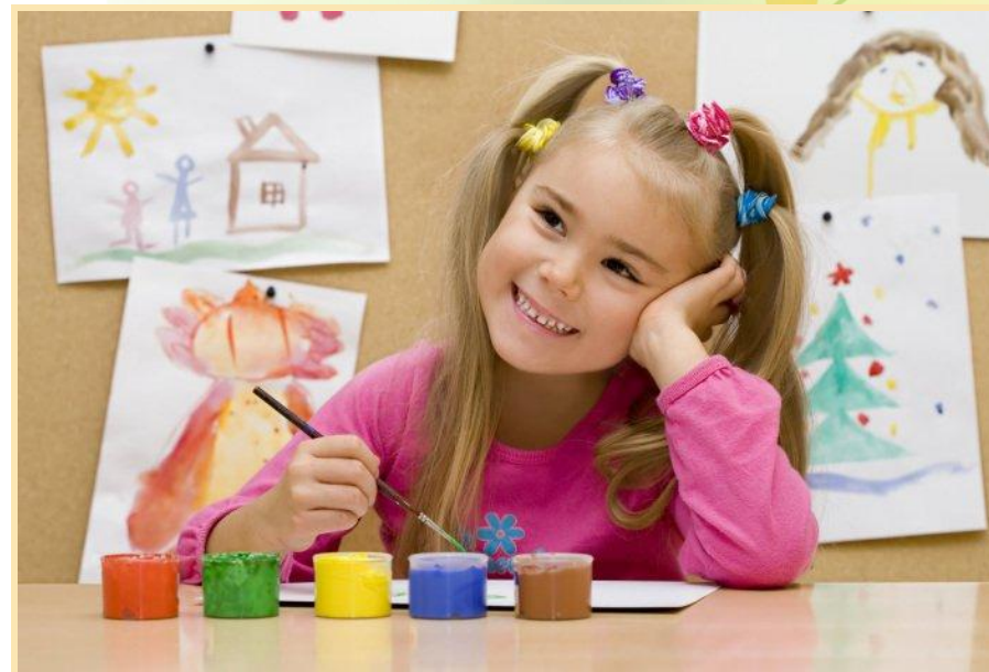
Изобразительная: рисование, лепка, аппликация.