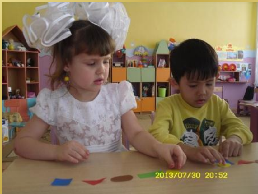
Индивидуальные игровые задания «Собери бусы»