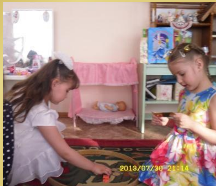
Сотрудничество детей в парах И/у «Шифровка»