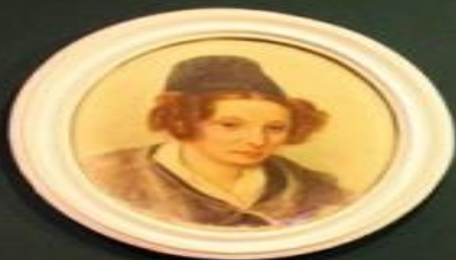
Small rectangular label below the portrait.