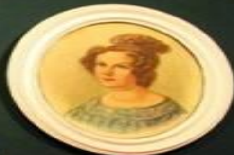
Small rectangular label below the portrait.