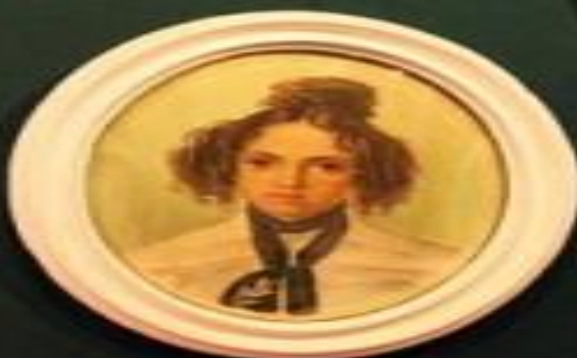
Small rectangular label below the portrait.