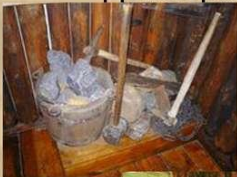
Руда, которую добывали декабристы