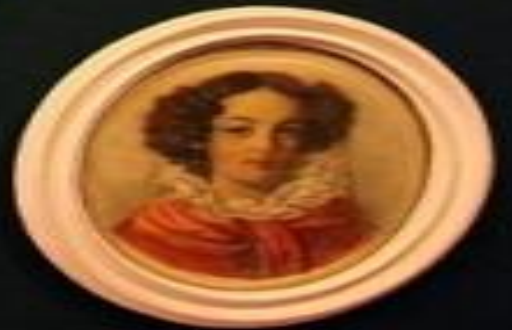
Small rectangular label below the portrait.