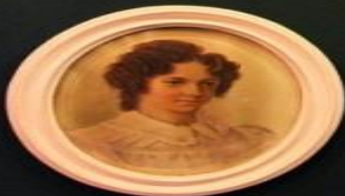
Small rectangular label below the portrait.