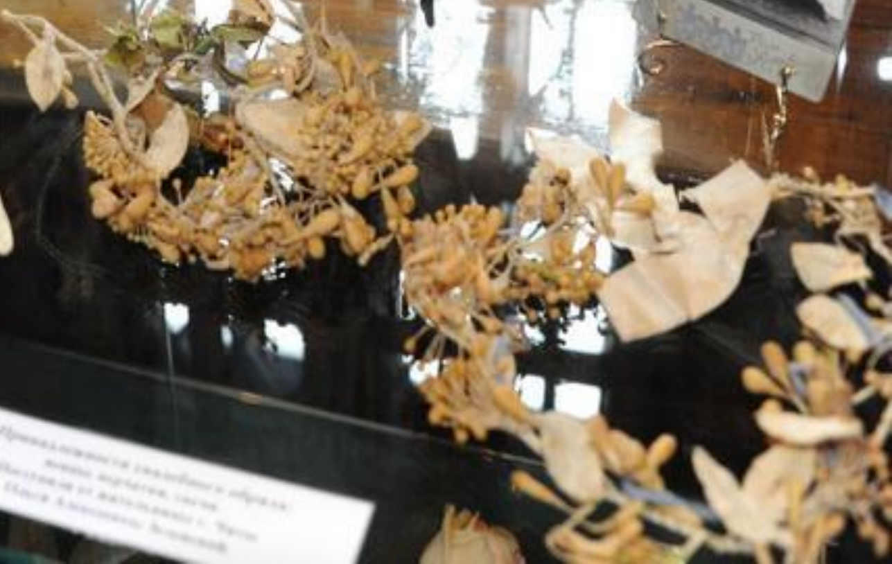
Применение в украшении одежды иногда в качестве знака достоинства и уважения к себе и к окружающим людям