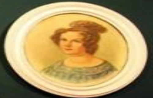
Small rectangular label below the portrait.