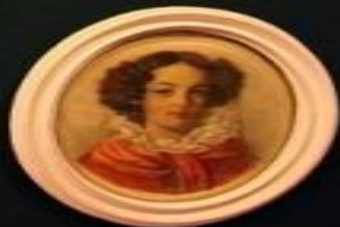
Small rectangular label below the portrait.