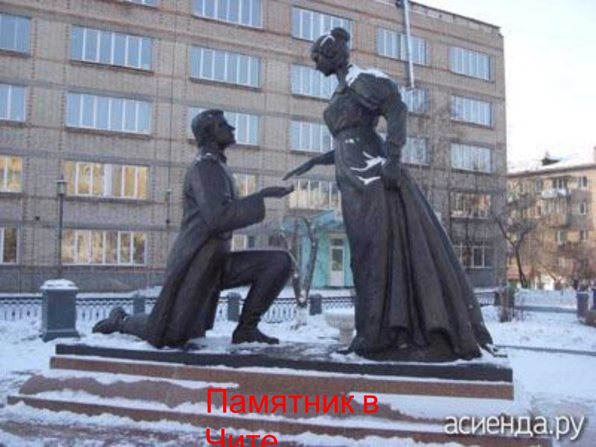
Памятник в Чите