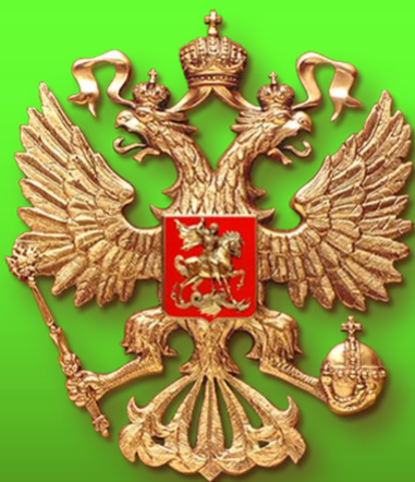
Государственный герб Российской Федерации