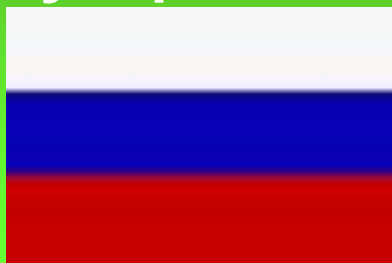
Государственный флаг Российской Федерации

Согласно статье 70 Конституции Российской Федерации в стране имеются Государственный флаг, Государственный герб и Государственный гимн