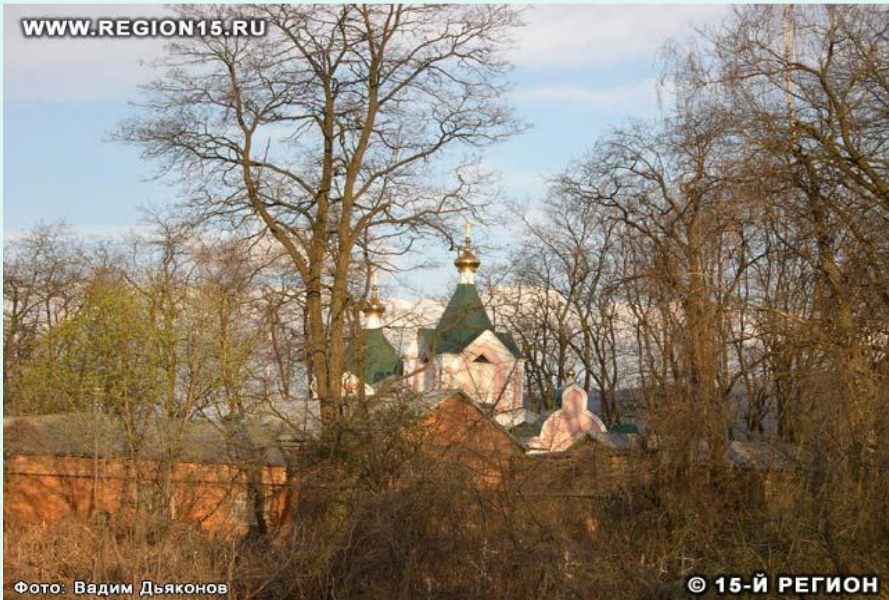
Фото: Вадим Дьяконов