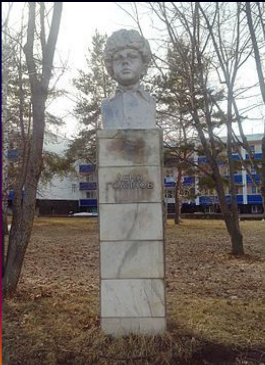
памятник на территории пионерского лагеря «Алые паруса» близ г.Тольятти