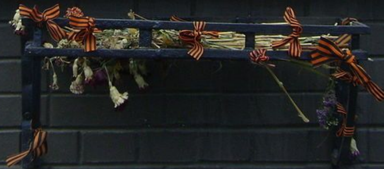
Памятная доска в Санкт-Петербурге . Улица Зины Портновой

ЗИНЕ ПОРТНОВОЙ ПОСМЕРТНО ПРИСВОЕНО ЗВАНИЕ ГЕРОЯ СОВЕТСКОГО СОЮЗА.