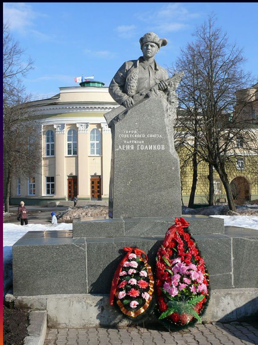
памятник в Великом Новгороде