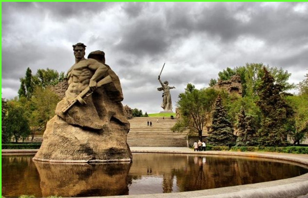
Мамаев курган и Родина-мать в Волгограде