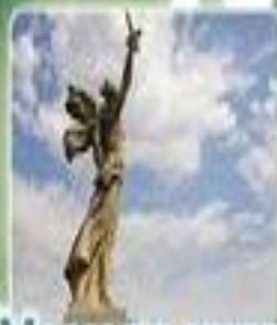
МАМАЕВ КУРГАН И СТАТУЯ РОДИНЫ-МАТЕРИ