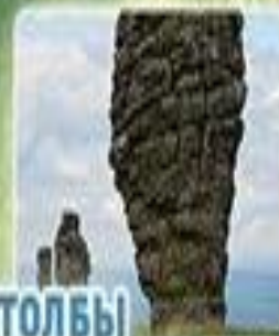
СТОЛБЫ ВЫВЕТРИВАНИЯ НА ПЛАТО МАНЬ-ПУПУ-НЁР