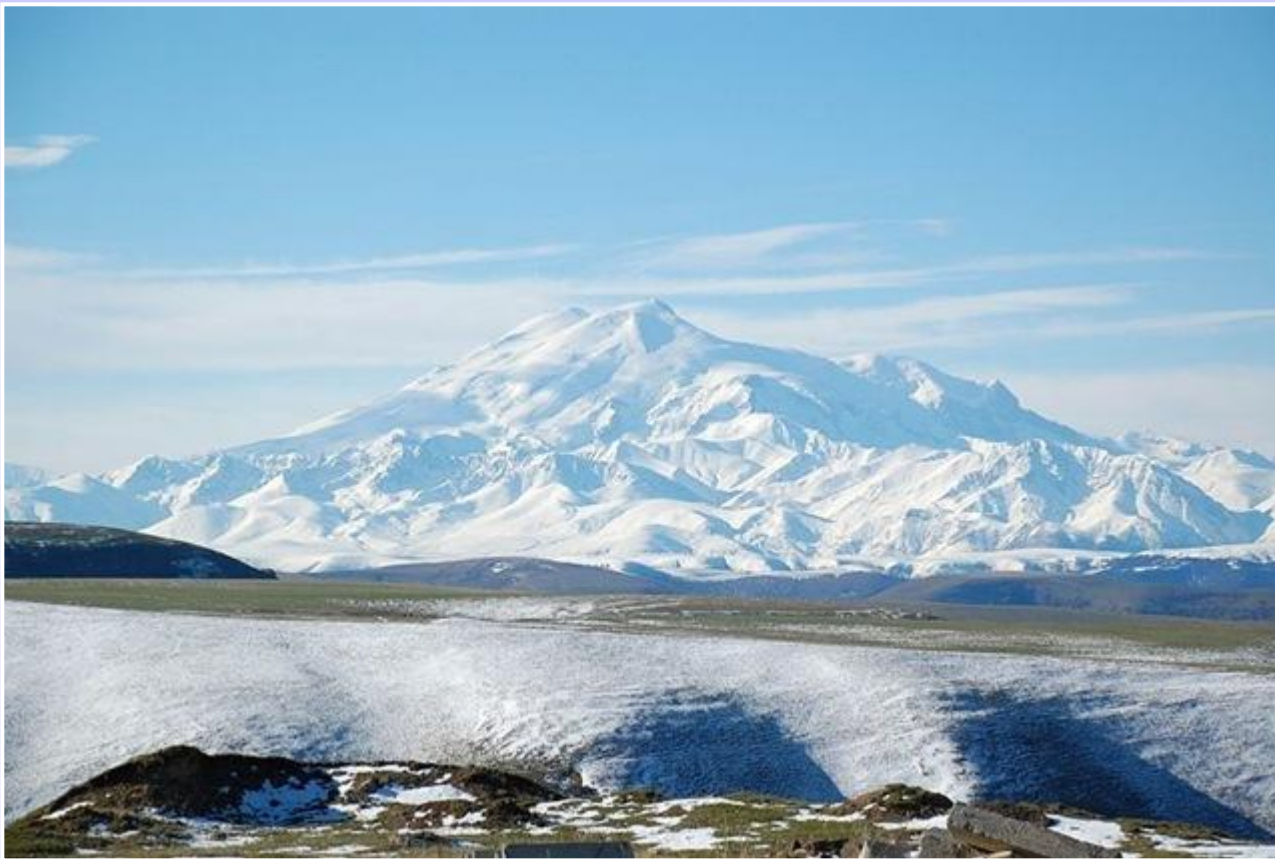
Гора Эльбрус на Кавказе