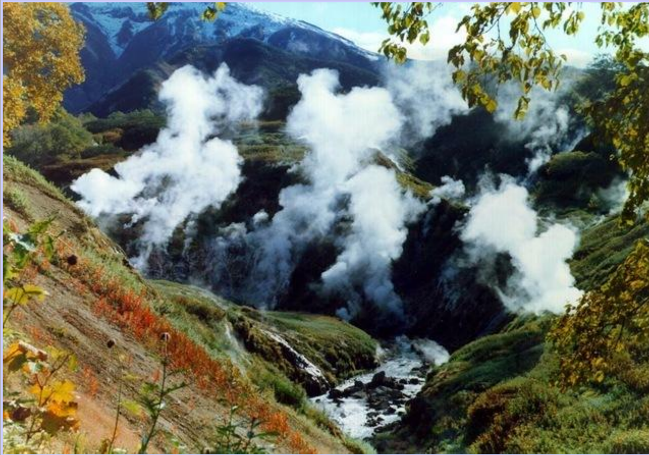
Долина гейзеров на Камчатке