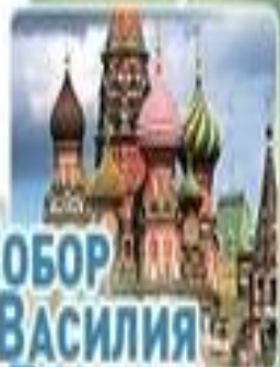
СОБОР ВАСИЛИЯ БЛАЖЕННОГО