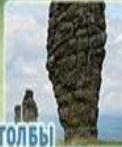
СТОЛБЫ ВЫВЕТРИВАНИЯ НА ПЛАТО МАНЬ-ПУПУ-НЁР