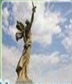
МАМАЕВ КУРГАН И СТАТУЯ РОДИНЫ-МАТЕРИ