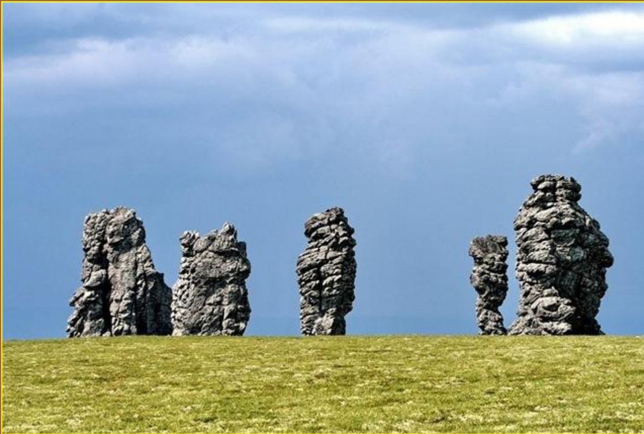
Столбы выветривания на плато Мань-Пупу-нёр