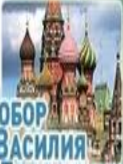
СОБОР ВАСИЛИЯ БЛАЖЕННОГО