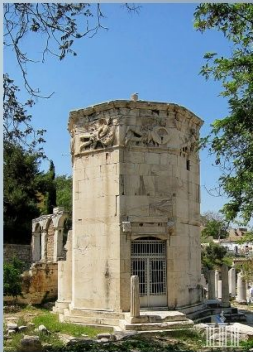
Башня Ветров в Афинах

В своих руках флюгер-тритон держал жезл, который и крутился на ветру. А находившийся над божественным флюгером фриз башни был украшен изображениями восьми направлений ветров. Кроме того на башне ветров были устроены солнечные и водяные часы. Вообще в Греции и Риме флюгеры с изображениями разных богов и героев нередко украшали богатые дома.