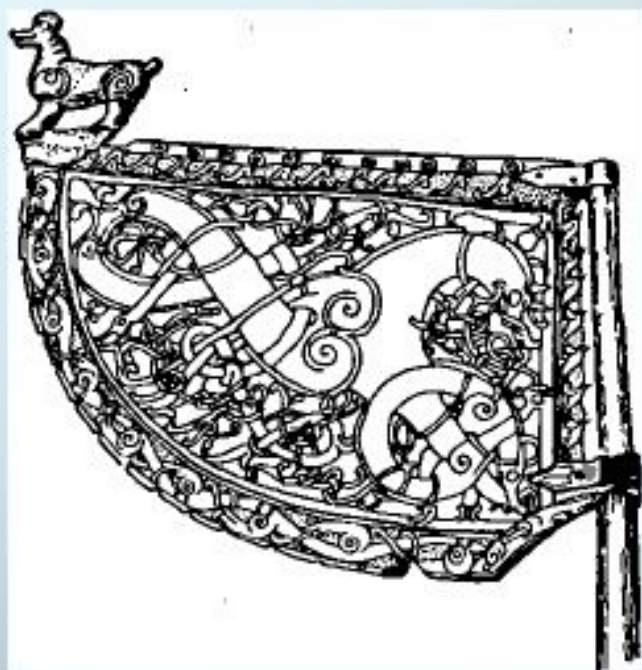
Флюгер, украшавший, вероятно, мачту корабля викингов

Приблизительно с IX века флюгера стали пользоваться успехом у викингов. Флюгер в виде фигурок зверей или мифологических существ из легенд стал неотъемлемым декоративным элементом корабля. Скорее всего, его помещали на особый столб на палубе или даже на нос корабля. Железные флажки с различными изображениями сначала появились на мачтах кораблей, а потом и на домах моряков.