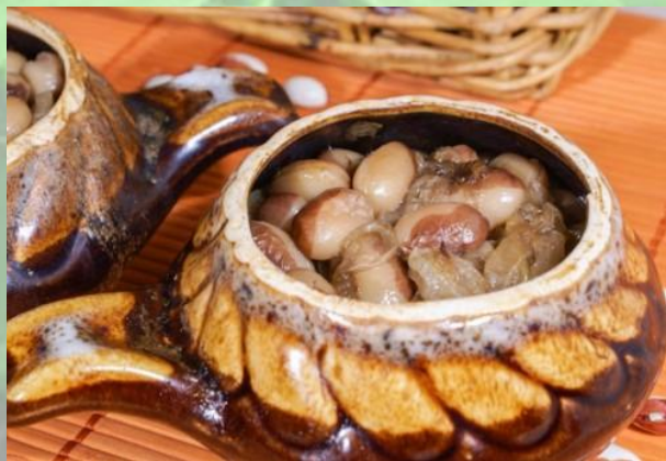
Фасоль в горшочках по- гречески