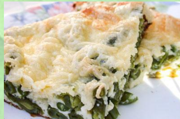
Запеканка из стручковой фасоли