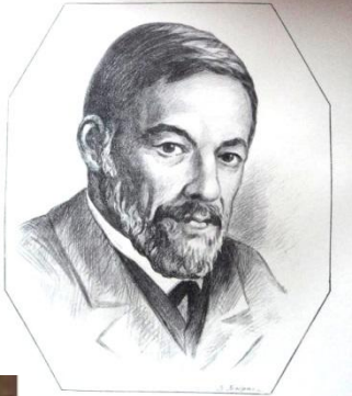
СЕЧЕНОВ ИВАН МИХАЙЛОВИЧ (1829-1905)

В зале общих собраний думы (Александровском) в 1862 году проводились публичные лекции «Воле университета» с участием И. М. Сеченова, Д.И. Менделеева, А. Н. Бекетова, Н. И. Костомарова.