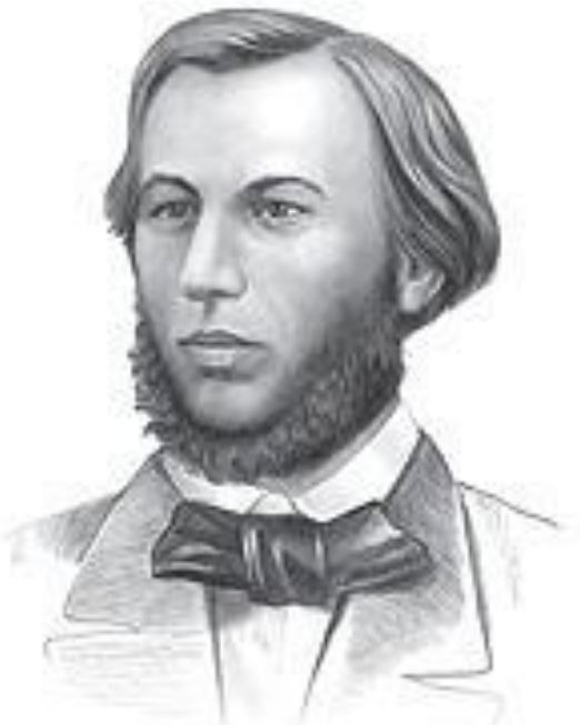
Николай Николаевич Бекетов 1827—1911