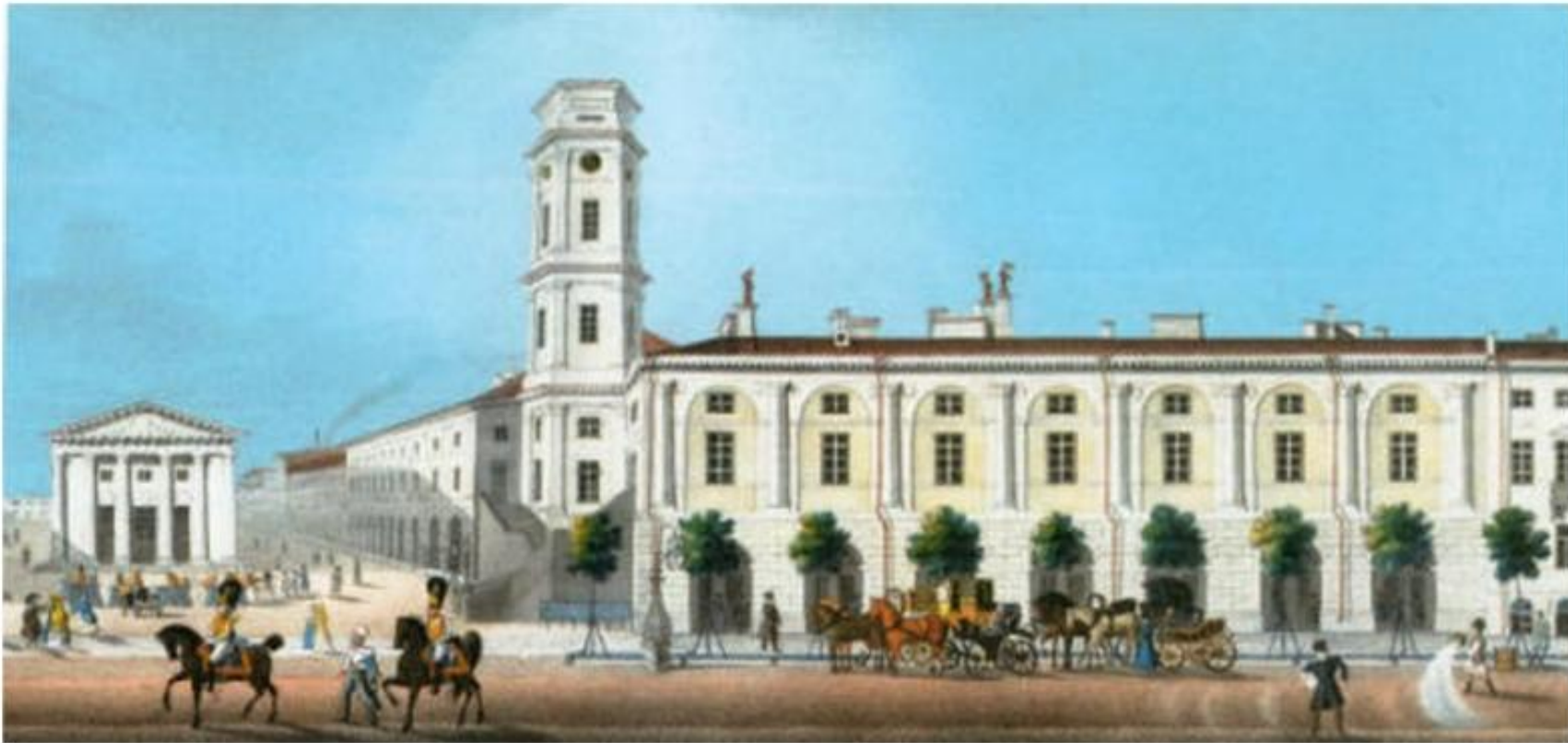
Серебряные ряды. Фрагмент "Панорамы Невского проспекта". Литография И. А. Иванова с рис. В. С. Садовникова. 1830.

В нижнем этаже здания городской думы находились лавки для различных товаров;