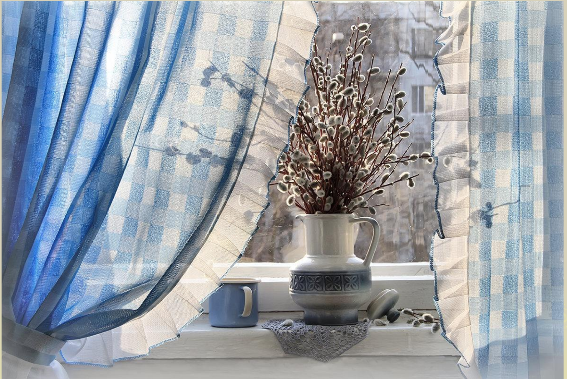
Барабанит по стеклу Серой лапкой верба.